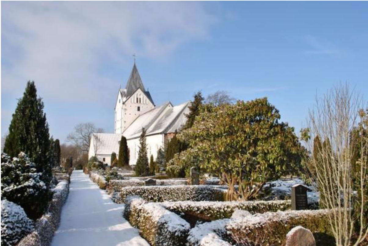
Sdr. Bjert kirke. Tårnet er bygget 1450-1500 og er af den Tørninglenske type med de fire gavlspidser.

Det er et stort projekt – og en stor succes, hvis det lykkes at gennemføre!